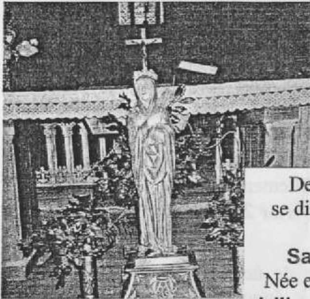
SAINTE AGATHE (Sculpture en bois)